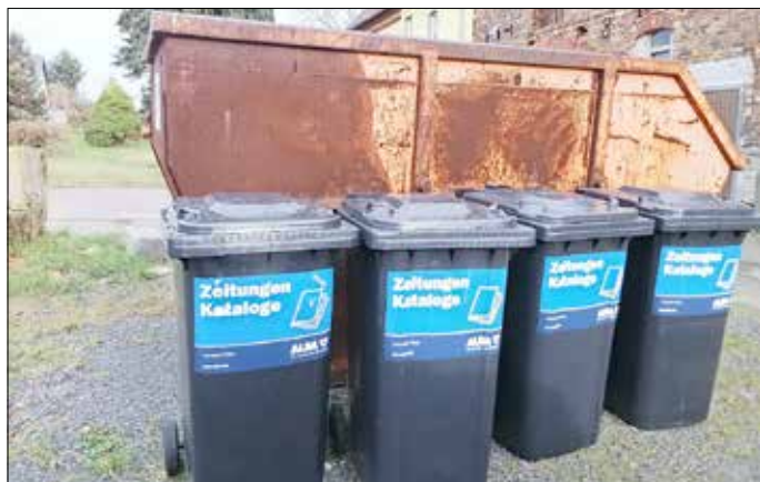
Papiertonnen in Falkenberg

Wenn Sie die Jugendfeuerwehren unterstützen wollen, dann bringen Sie Ihre alten Zeitungen und Kataloge zu diesen Papiertonnen. Bitte keine Pappe einwerfen. Vielen Dank.