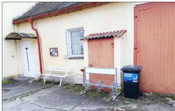
Papiertonne in Dahlenberg